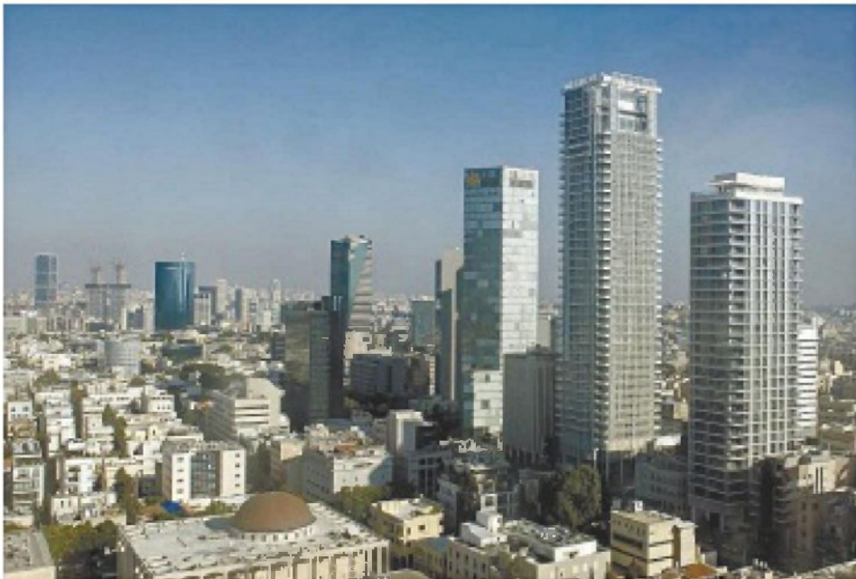
מגדלי משרדים ומגורים במרכז תל אביב. "הסיווג שווה הרבה מאוד כסף"

בבית המשפט טענה השבשבת כי הוועדה שדנה בשינוי הסיווג לא הגדירה מהם מאי פיינו של בית תוכנה, והיעדר ההגדרה או מוביל לטעויות בהפעלת שיקול הדעת. "פיתוח מדור לדור הוא תהליך ייצור של תוכנה חדשה. כל דור חדש מתיבסס על הדור הישן."