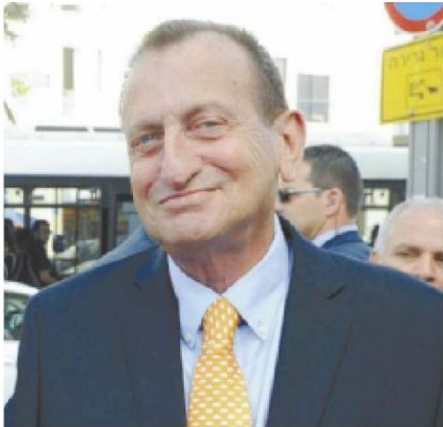
רון חולדאי, ראש עיריית תל אביב-יפו